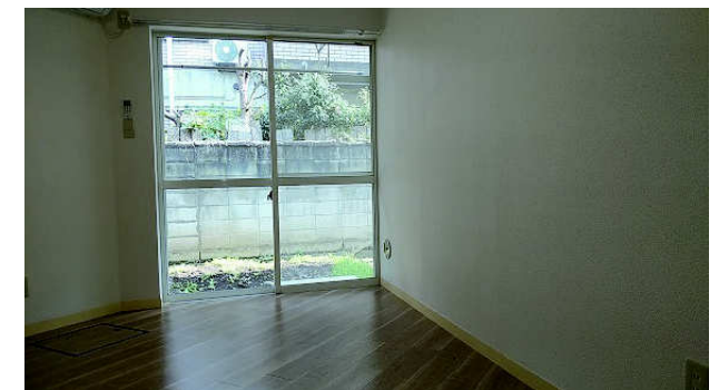
図面と現況が異なる場合は現況を優先します。