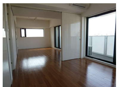
参考: 同タイプの別のお部屋の写真です