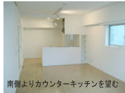
南側よりカウンターキッチンを望む

主にディンクスの使用を想定、 南北に長いLDKを持ち、 採光と開放を演出する心地よい空間。