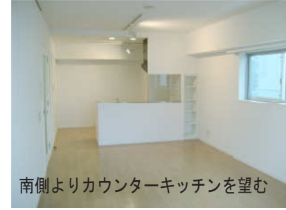
南側よりカウンターキッチンを望む

主にディンクスの使用を想定、南北に長いLDKを持ち、採光と開放を演出する心地よい空間。