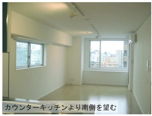
カウンターキッチンより南側を望む

主にディンクスの使用を想定、南北に長いLDKを持ち、採光と開放を演出する心地よい空間。