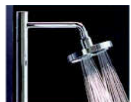
オーバーヘッドシャワー 頭上からお湯が降り注ぎ、全身を温めてくれます。