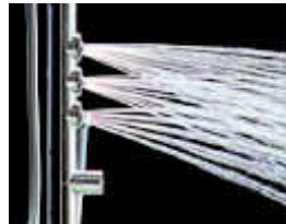
ボディシャワー 3ヶ所からお湯が噴出し、角度調整ができます。