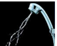
ハンドシャワー マッサージシャワーとスプレーシャワーが選べます。